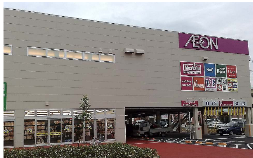
ブックオフ 沼津南店 (マックスバリュ 沼津南店 1F)